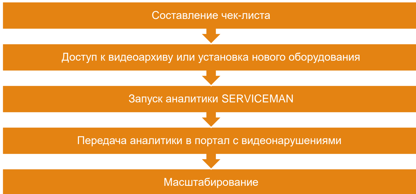
Схема работы Video Assistant